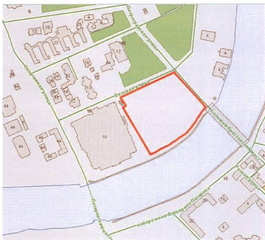
СХЕМА РАЗМЕЩЕНИЯ ОБЪЕКТА